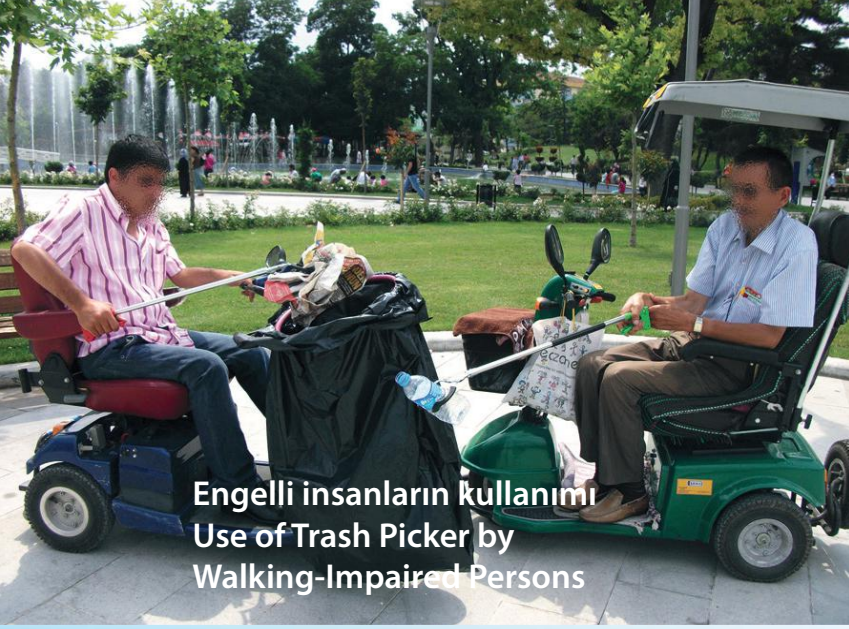
Engelli insanların kullanımı Use of Trash Picker by Walking-Impaired Persons