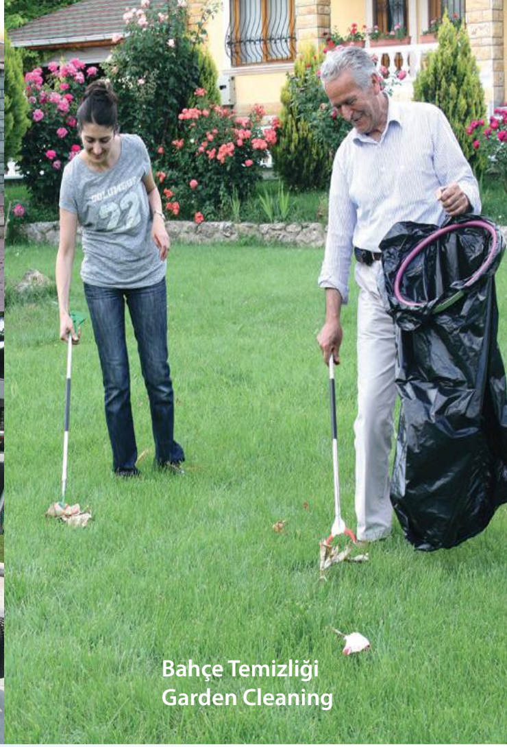
Bahçe Temizliği Garden Cleaning