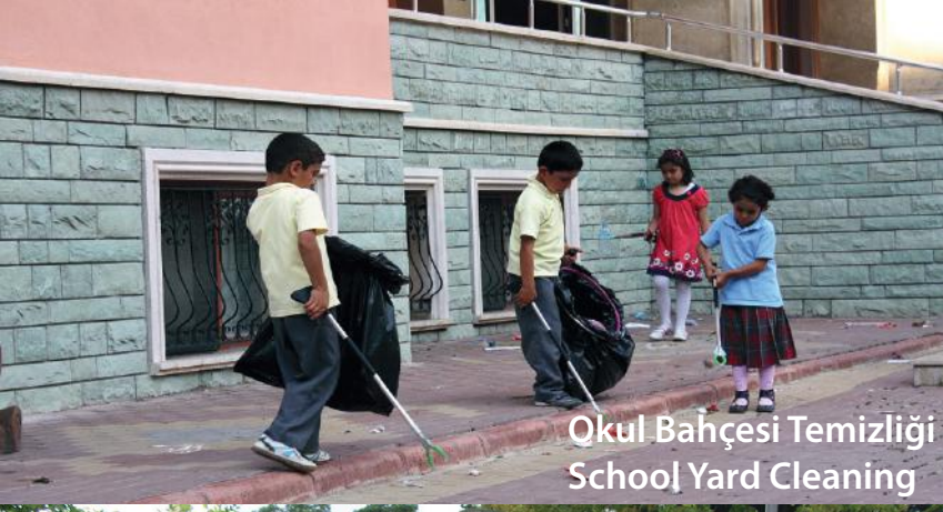
Okul Bahçesi Temizliği School Yard Cleaning