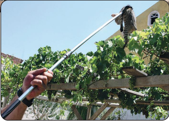
Hayvan Kurtarma Seti Animal Rescue Kit